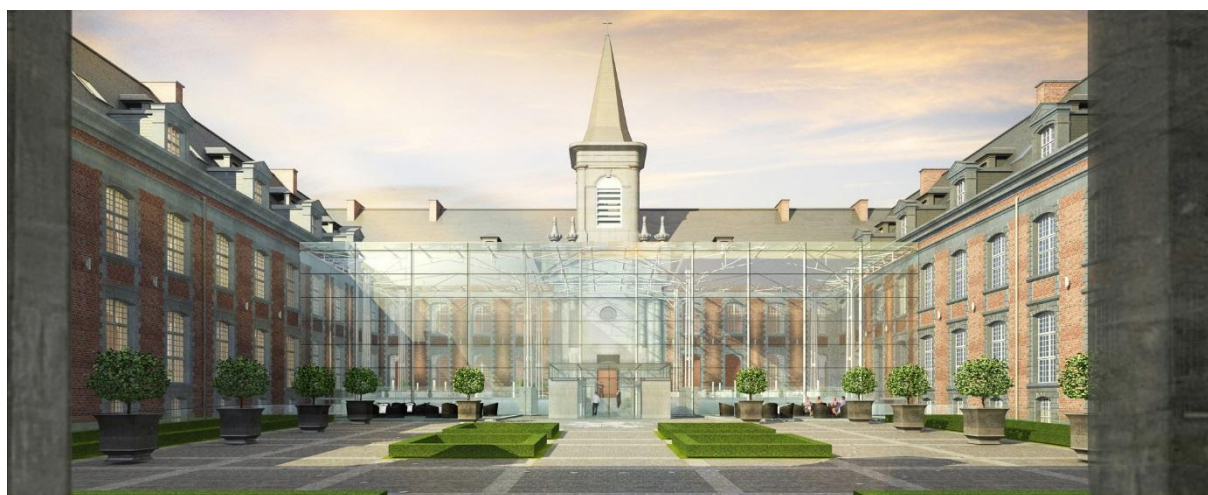
Hôtel Royal du Hainaut in Valenciennes

Sinds een paar maanden herbergt het oude militaire hospitaal van Valenciennes een viersterrenhotel: het Hôtel Royal du Hainaut. Het was een ambitieus project om hedendaagse architectuur te verwerken in een officieel monument vol geschiedenis. Maar nu kan iedereen een onvergetelijk moment beleven in dit bijzondere decor. Het hotel telt 79 kamers, een traditionele brasserie, een wellnessruimte van 1.400 m 2 en een jazzclub.