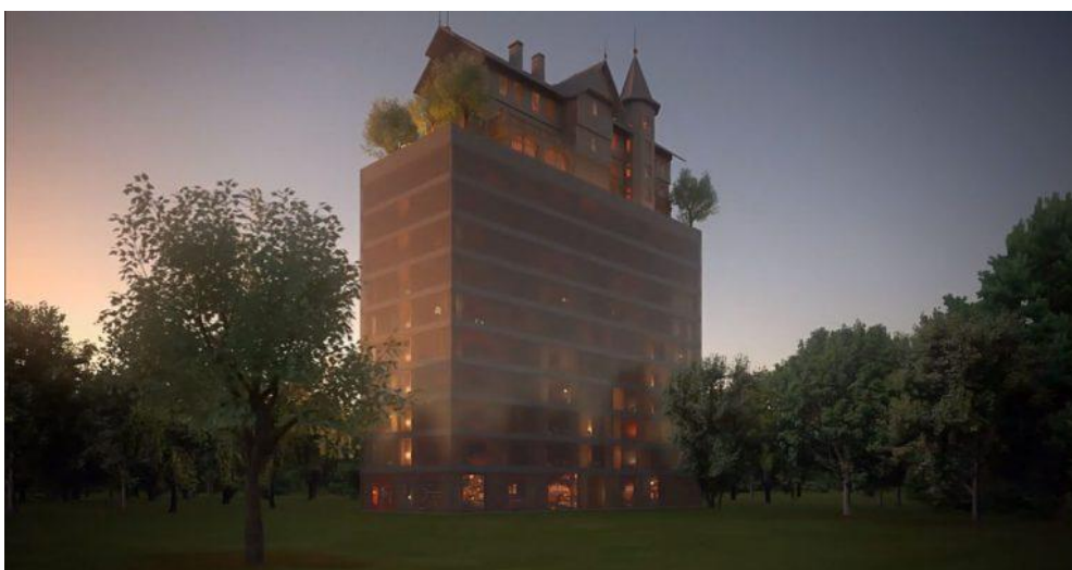
Een hotel van vijftig meter hoogte, bedacht door Philippe Starck in Metz

Hotel Marriott Autograph Collection opent in juni 2019 de deuren van zijn 5.500 m 2 grote etablissement, dat 89 kamers - waaronder zeventien suites - telt waarvan ongeveer de helft uitzicht heeft op de kathedraal van Reims. Ook komt er een Spa Urbain van 450 m 2 (met vijf behandelruimtes, zwembad, sauna, hammam en fitnesszaal), een bar-restaurant met terras ( negentig couverts), drie vergaderzalen en valet-parkeerservice. De art-deco façade van deze oude brandweerkazerne blijft intact en wordt in ere hersteld.