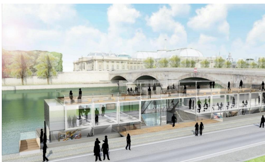
Fluctuart à Paris

De opening staat gepland in 2024, het jaar waarin Parijs de Olympische Spelen organiseert en waarin ook het metrostation van lijn 14 wordt geopend waarmee je deze toekomstige Cité de la Gastronomie van Paris-Rungis bereikt. Het thema is duurzame voeding en een verantwoordelijke gastronomie, met veel culturele en artistieke accenten.