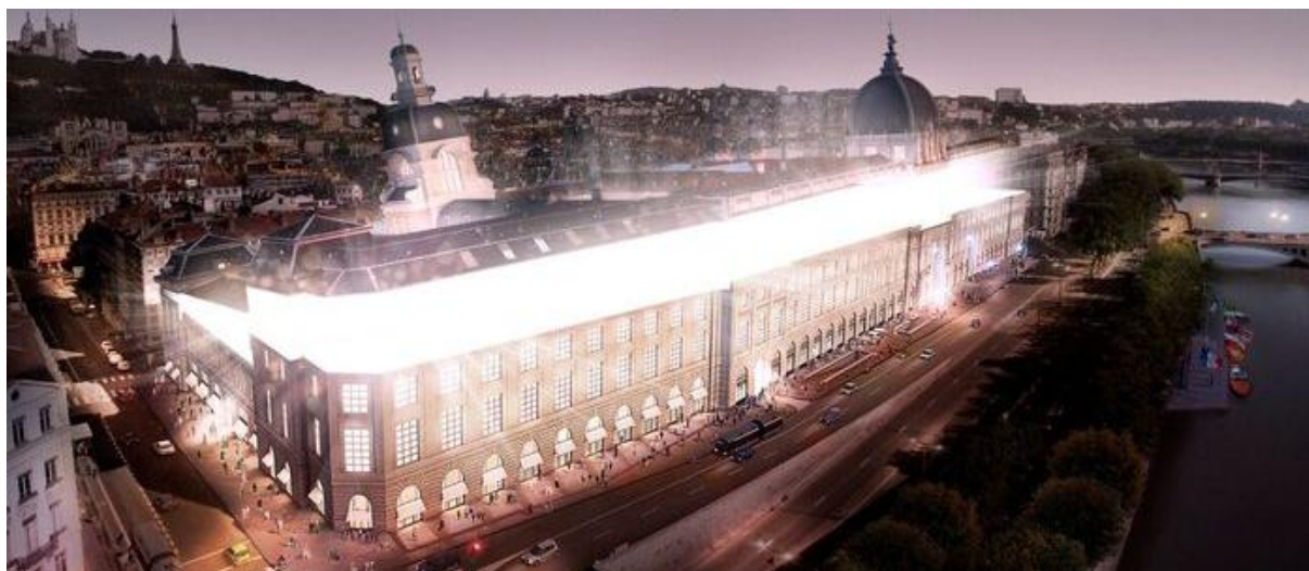
Le Grand Hôtel-Dieu in Lyon